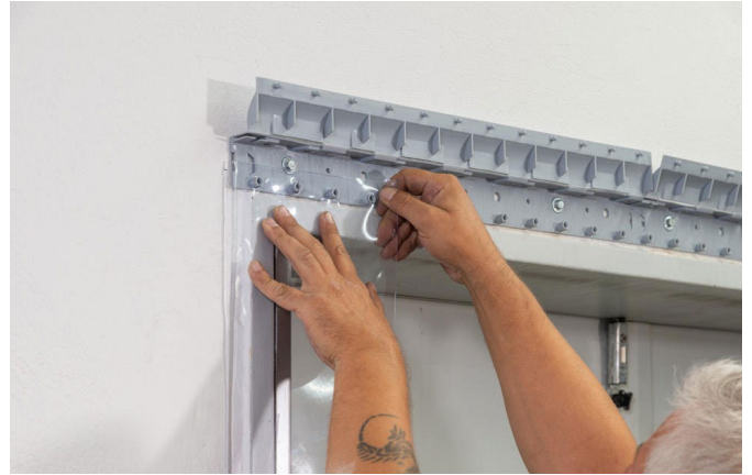
4. Streifen einhängen