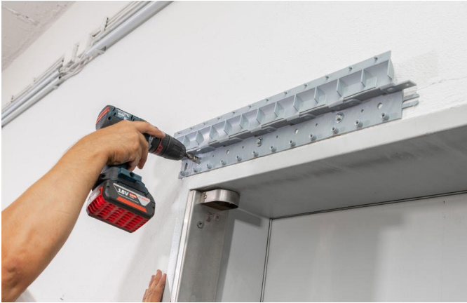
3. Schiene befestigen