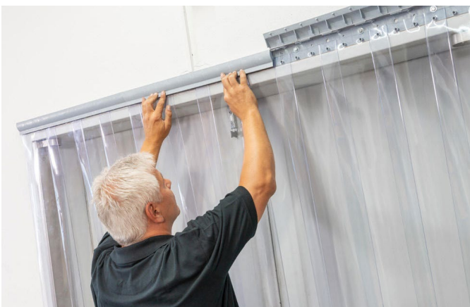
5. Schiene zuklappen