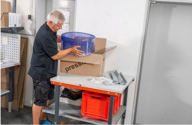
1. Pressio.fix auspacken