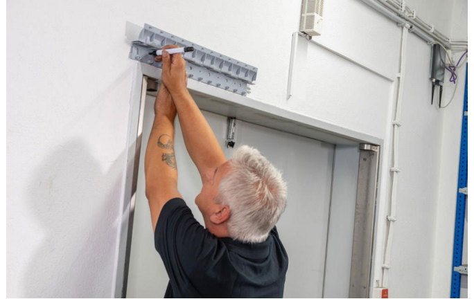
2. Löcher anzeichnen und bohren